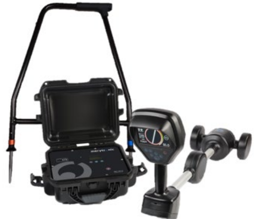
(*) El equipo MRT-700 debe solicitarse con Funcionalidad de Detección de Fallas

El MRT-700 permite realizar simultáneamente el trazado de la ruta del cable y la detección de fallas.