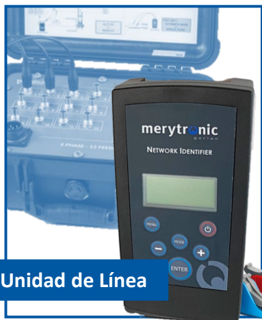
Unidad de Línea

Complementa el equipo ILF - Identificador de Línea y Fase con la funcionalidad de Identificación de Cable .