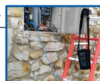
Unidad de Línea - Transmisor